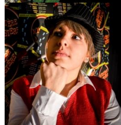
Nadine Festor Court